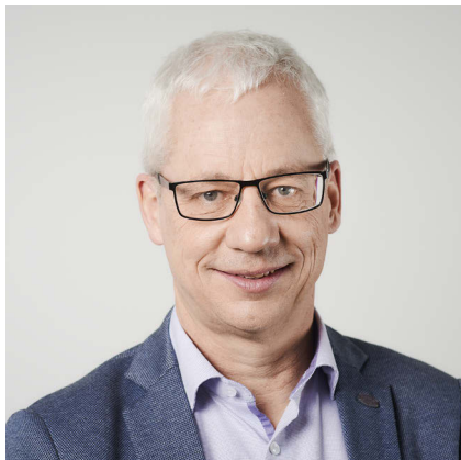
Christophe Nydegger Präsident, Schweizerische Berufsbildungsämter- Konferenz SBBK

«Die SBBK begrüsst die Optimierungen im Berufsentwicklungsprozess. Den Kantonen ist wichtig, dass ihre Anliegen frühzeitig in die Berufsrevisionen eingebracht werden und dass die Änderungen in der Berufsfachschule umsetzbar sind. Dann lebt die Verbundpartnerschaft!»