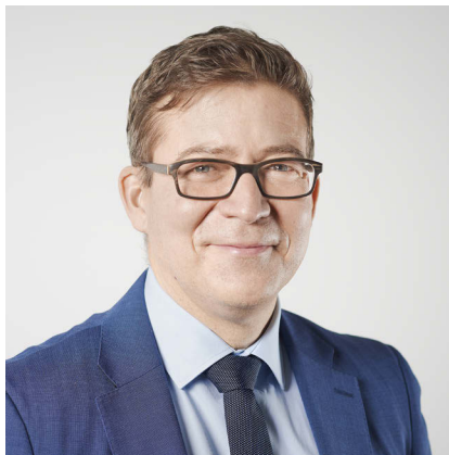
Niklaus Schatzmann Vizepräsident, Schweizerische Berufsbildungsämter- Konferenz SBBK